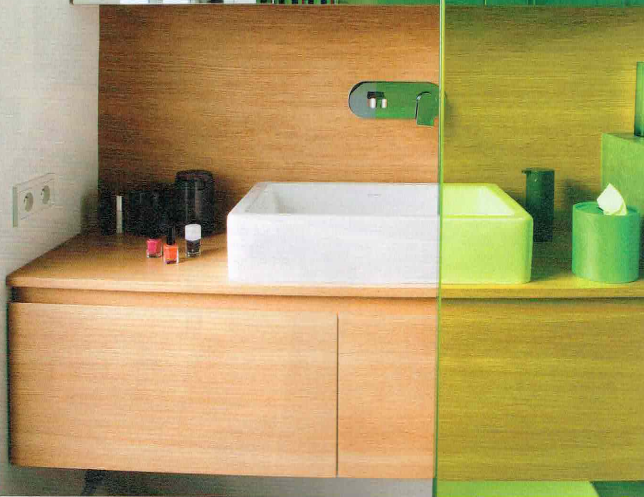
Les rangements, fabriqués sur mesure, occupent toute la longueur de la pièce. Accessoires en PMMA gris « Binilo » (création Piero Lisoni pour Alessi).

REFLETS Les façades à miroirs créent un bel effet de profondeur.